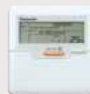
Проводной пульт ДУ

* Пульт ДУ находится в одной упаковке с внутренним блоком.